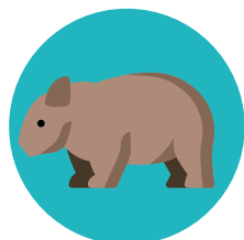
造訪動物保育中心